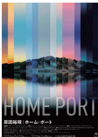
広島市現代美術館での個展ポスター

このような機会を与えてくださった関係者の皆さま、そして普段から応援してくださっている皆さまに心から感謝申し上げます。