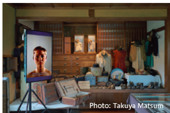
日本ハワイ移民資料館での個展風景