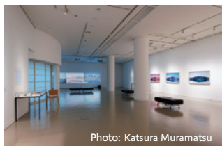
広島市現代美術館での個展風景